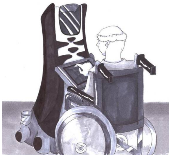
Bild 4 Aktivitäts-Szenario

Dieses Szenario soll eine "Aktivierung" der Bewohner bewirken, indem diese durch entsprechende Angebote zu Aktivitäten angeregt werden. Über den Care-O-bot ® sind verschiedene Unterhaltungsprogramme, wie z. B. Spiele, wählbar. Da die Bereitschaft, Vorlieben und Fähigkeiten der Bewohner einer Pflegeeinrichtung sehr unterschiedlich sind, sollen die Angebote durch Pflegekräfte und Therapeuten angepasst an die jeweiligen Bewohner ausgewählt und initialisiert werden.