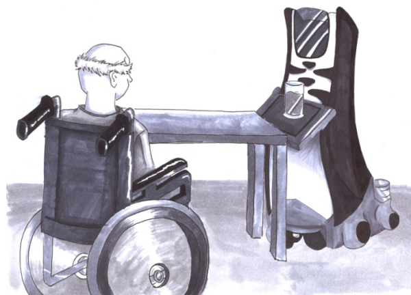
Bild 3 Getränkeversorgungs-Szenario

Das folgende Szenario beschreibt die typischen Aufgaben auf den Stationen, die im Umgang mit der Getränkeversorgung der Bewohner anfallen und vom Care-O-bot ® (entwickelt vom Fraunhofer-Institut für Produktionstechnik und Automatisierung) übernommen werden könnten. Hochbetagte Senioren neigen häufig dazu, zu wenig zu trinken - sei es aus Vergesslichkeit oder aus einer Vermeidungsstrategie heraus, die auf Inkontinenzprobleme oder auf das verringerte Durstempfinden im Alter zurückzuführen ist. Die ausreichende Versorgung mit Flüssigkeit stellt somit eine zentrale Aufgabe von Pflegeeinrichtungen dar, weswegen die Pflegekräfte bei bestimmten Bewohnern besonders darauf achten müssen, dass diese genügend trinken. Bei ihren Rundgängen füllen die Pflegekräfte die Flüssigkeit nach bzw. stellen den Bewohnern Getränke hin und bemühen die Bewohner darum, regelmäßig zu trinken. Über die Flüssigkeitseinnahme wird handschriftlich Protokoll geführt. Dabei kommt es nicht selten zu Lücken im Protokoll, die im Nachhinein aus dem Gedächtnis heraus ausgefüllt werden. Die Aufzeichnungen werden zur Schichtübergabe manuell in ein computergestütztes Dokumentationssystem eingepflegt. Das gesamte Vorgehen erfordert sehr viel Aufmerksamkeit und Zeit. Wird festgestellt, dass die Trinkmenge eines Bewohners nicht ausreicht, muss diesem notfalls per Infusion Flüssigkeit verabreicht werden.